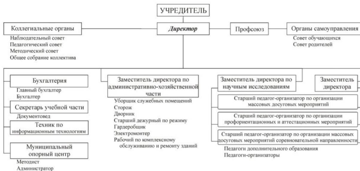
Схема организации управления и подотчетности

В образовательном учреждении сформированы коллегиальные органы управления, к которым относятся: наблюдательный совет, педагогический совет, общее собрание трудового коллектива, методический совет, совет родителей образовательного учреждения, совет обучающихся.